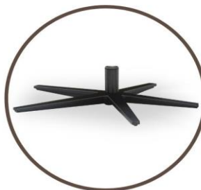
leg black or stainless steel