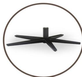
leg black or stainless steel