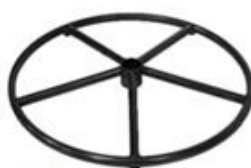
E) STER ROND E1) STER ROND ZWART