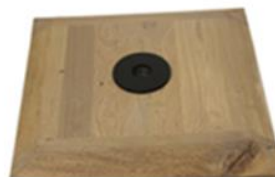
J) VOET HOUT J1) VOET HOUT ZWART