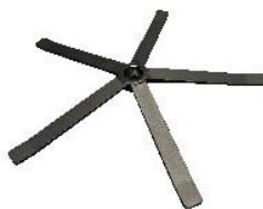
N) STER PLAT