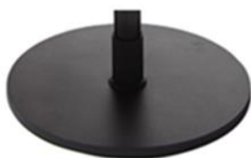
G) SCHIJF ROND ZWART