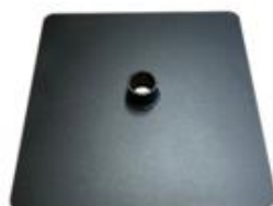
K) SCHIJF VIERKANT ZWART