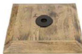
M) VOET HOUT GEBRAND