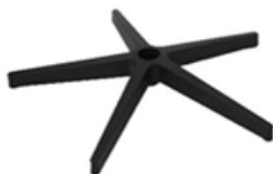
B) 5 TEENS ZWART