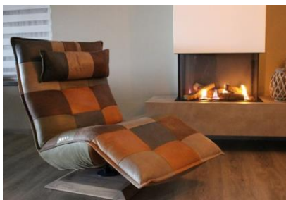
LET OP; OP DE FOTO ZIET U DIT MODEL IN PATCHWORK

Leder is een natuurproduct, dat betekend dat het mogelijk is dat er kleurverschillen zijn met uw staal.