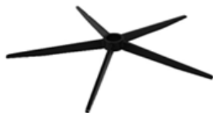
A) STERVOET ZWART