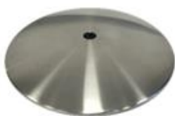
D) PLATVOET D1) PLATVOET ZWART