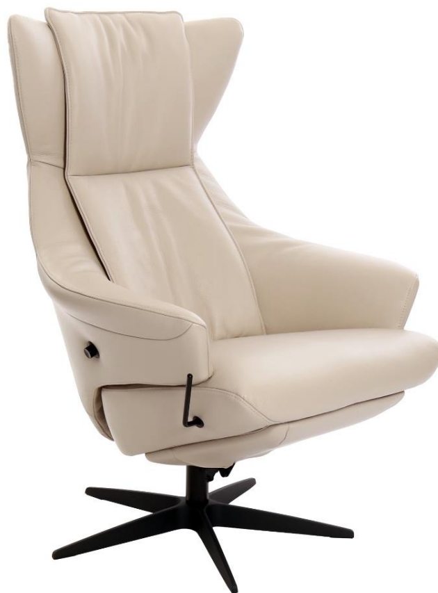
Afgebeeld Model TR