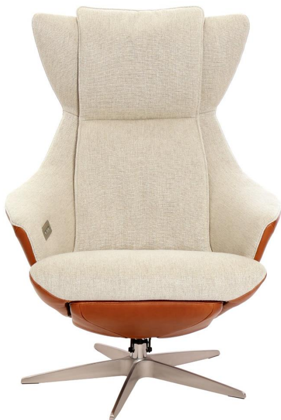
Afgebeeld Model ARC